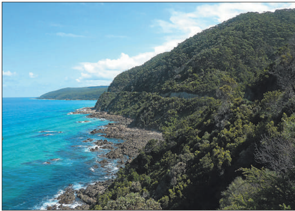
Dieses Bild hat Patrick gemacht, als er auf der Great Ocean Road unterwegs war. Das ist eine der wenigen Straßen, auf der man nach jedem Aussichtspunkt darauf hingewiesen wird links zu fahren.

Schickt eure Grüße per Mail an contact@x-bay.de direkt in die Redaktion oder werft sie in den Aber-Hallo-Kasten in der Kurier-Geschäftsstelle in der Maximilianstraße 58/60 in Bayreuth.