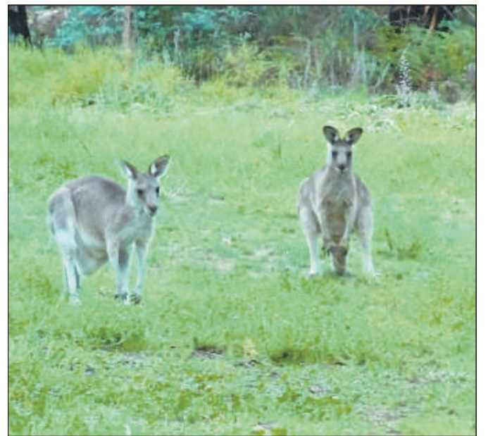
An diese jungen Riesenkängurus musste sich Patrick heranschleichen, damit er sie fotografieren konnte.